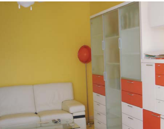
neues, modern eingerichtetes Wohnzimmer