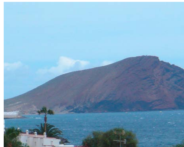
Textil- u. FKK-Strand am Roten Felsen