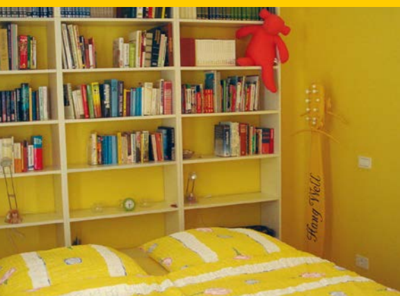
Blick ins Schlafzimmer