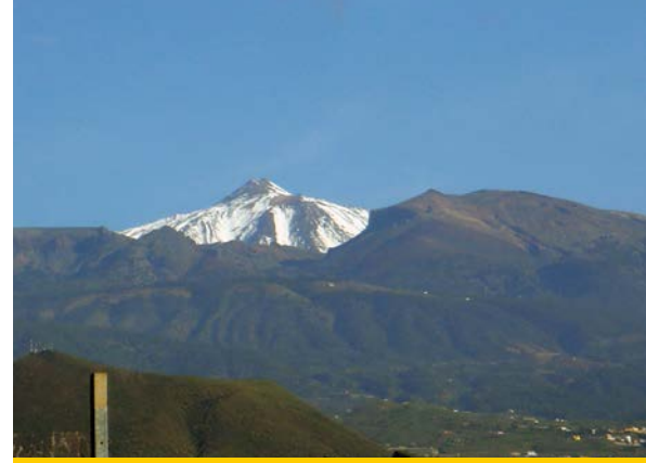
höchster Berg Spaniens der „Teide“