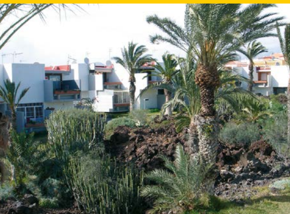
Blick vom Balkon auf den tropischen Garten